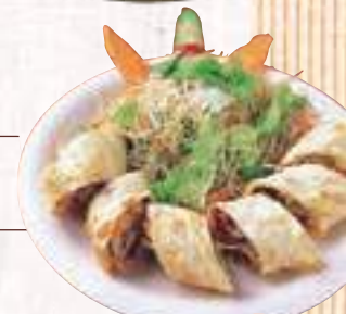
ナンロールサンド

●Ebi Mayo エビマヨ (エビの自家製ソース和え) 5P 600yen 10P 1100yen