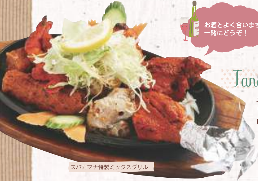
スバカマナ特製ミックスグリル

土で作り上げた「タンドール」という大きな釜の中に炭を入れてじっくりと焼き上げたインドの代表的なお料理です。自家製ミントソースをたっぷりつけてお召し上がりください。