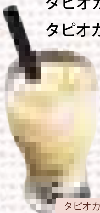
タピオカマンゴーラッシー